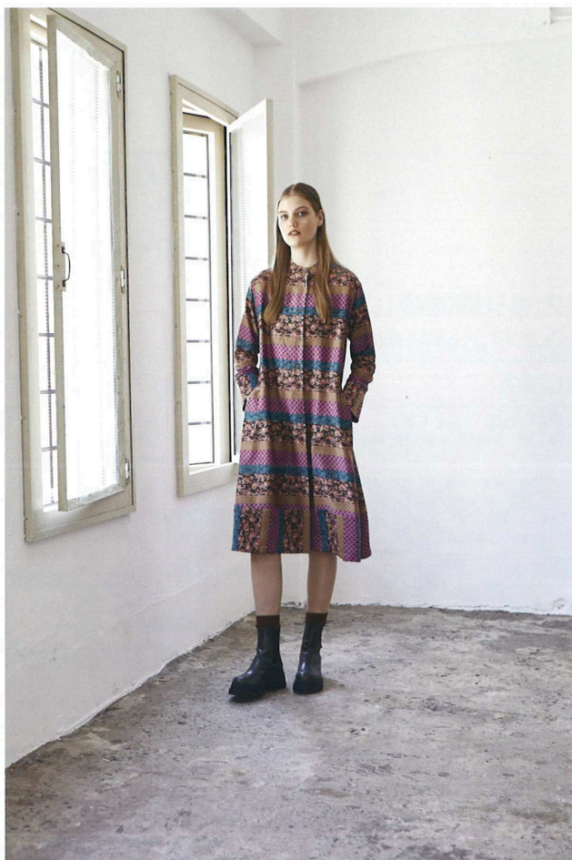
2021-22 Autumn&Winter Collection

好きな色。好きな柄。好きなかたち。 昔は違っていてもあったけれど、 いまのわたしは母に似ている。